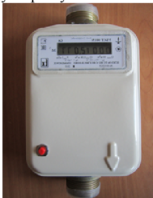
Рисунок 1 – Общий вид счетчиков газа ультразвуковых УБСГ

Общий вид счетчиков газа ультразвуковых УБСГ представлен на рисунке 1.