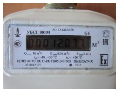
Рисунок 3 – Маркировочная табличка счетчика газа УБСГ